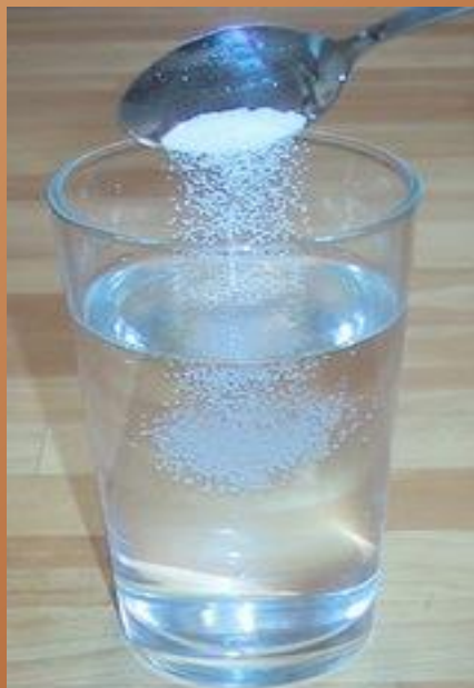
νερό κ αλάτι