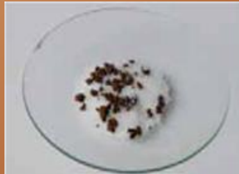
καφές και ζάχαρη